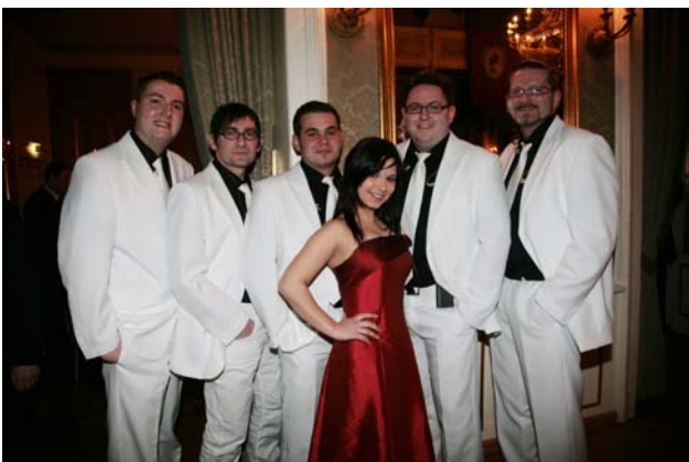
„soundhaufn“ - Die Partyband aus OÖ sorgte für gute Stimmung